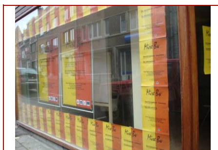
Des affiches facilitent le repérage du bâtiment voisin

Nous étudions ici l'identification du bâtiment dans son environnement et le franchissement de l'entrée.