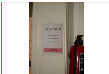
Panneau d'indication à l'entrée des bureaux

Nous étudions ici la présence et l'organisation d'informations visuelles, ainsi que la continuité de la signalétique.