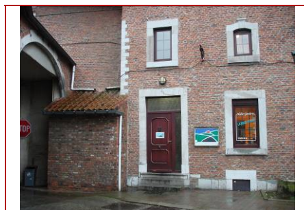
Entrée du bâtiment

L'entrée du bâtiment est précédée de trois marches qui empêchent naturellement le franchissement en chaise. Les personnes marchant difficilement ne pourront pas avoir accès non plus car la disposition des marches ne permet pas de prendre un appui convenable afin de garantir sa sécurité.